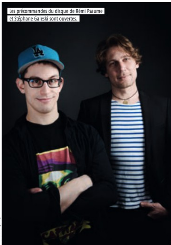
L. Khani / longvisay

Les précommandes du disque de Rémi Psaume et Stéphane Galeski sont ouvertes.