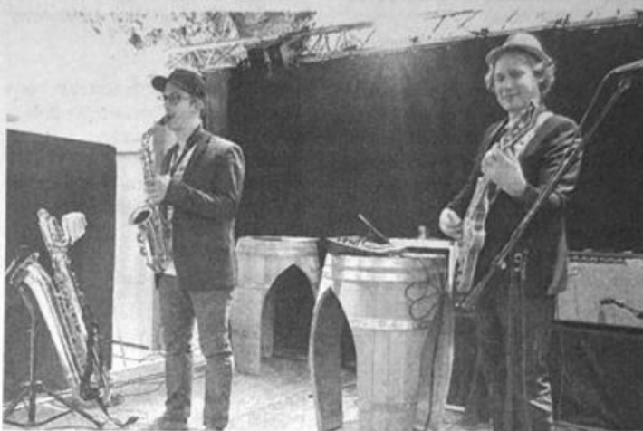
Le groupe F.E.U prépare la sortie de son premier album prévu en 2020.